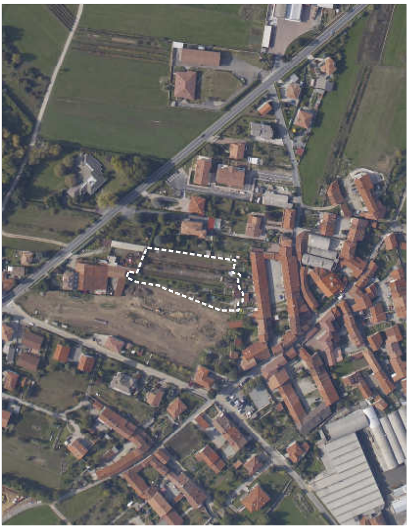
TAVOLA N. 7 SCALA 1:200